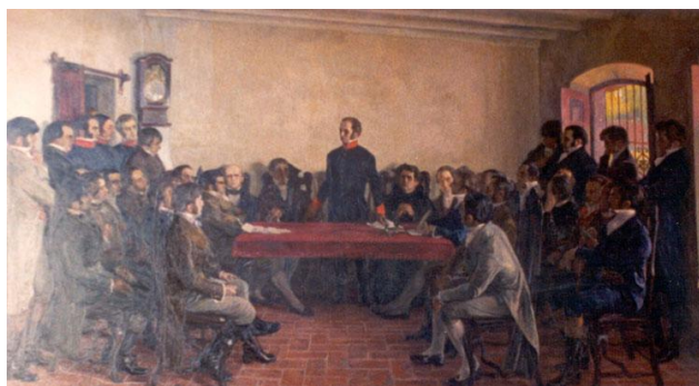
Óleo sobre tela de Pedro Blanes Viale

El 5 de abril de 1813 se realizó el Congreso de Tres Cruces – también llamado Congreso de Abril– que sesionó hasta el 21 de abril de ese año en la quinta de Manuel José Sáinz de Cavia, en el paraje extramuros –hoy día barrio– de Tres Cruces, en Montevideo. Allí se reunieron los representantes del Pueblo Oriental ante la presencia de José Gervasio Artigas, elegido Jefe de los Orientales unos años antes. Fueron convocados diputados que representaban a los pueblos de la Provincia Oriental y su concreción fue de capital importancia para el desarrollo del artiguismo, pues sentó las bases de las ideas federalistas y republicanas del Prócer.